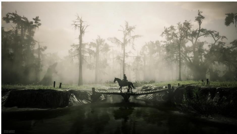
Red Dead Redemption 2 / Going for a Nice Walk