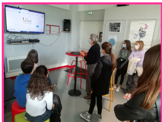
Les 5èmes à la découverte de la SIJ en mars 2021